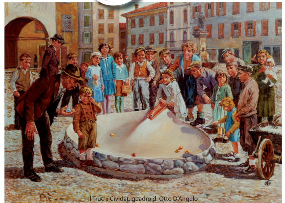
Il Truc a Cividât, quadro di Otto D'Angelo

tutti sono invitati a partecipare al tradizionale