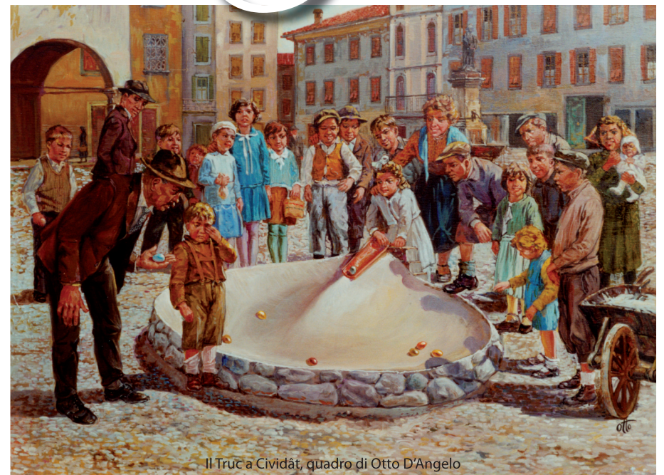
Il Truc a Cividât, quadro di Otto D'Angelo

tutti sono invitati a partecipare al tradizionale