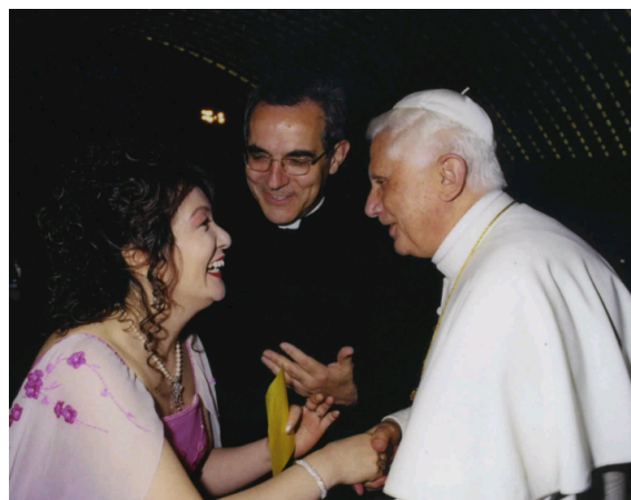
Mika Kunii insieme al Papa Emerito Benedetto XVI