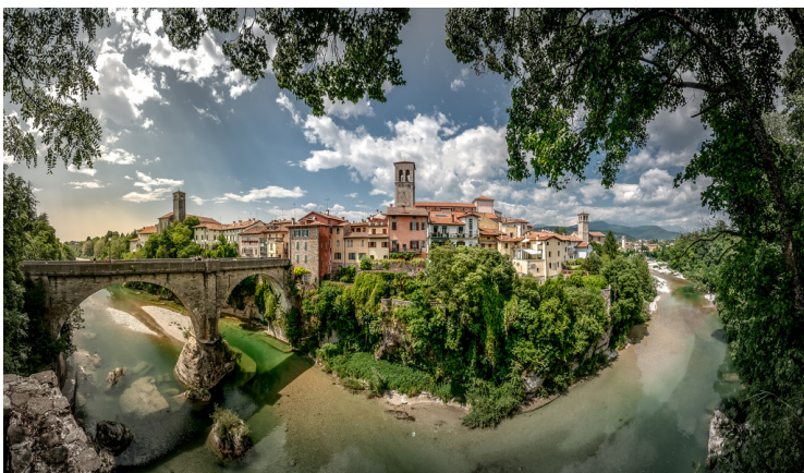
Il ponte del diavolo, Cividale del Friuli

Il Festival di Pasqua, realizzato dall'Associazione La Via di Marco Polo - Un Palcoscenico per il Mondo , si terrà nei giorni di venerdì 25 e lunedì 28 Marzo presso l'Auditorium della Chiesa di S. Francesco a Cividale del Friuli . Dal programma delle due serate, "Elevati Anima Mia" e "Sorgi Anima Mia" , pensate per celebrare